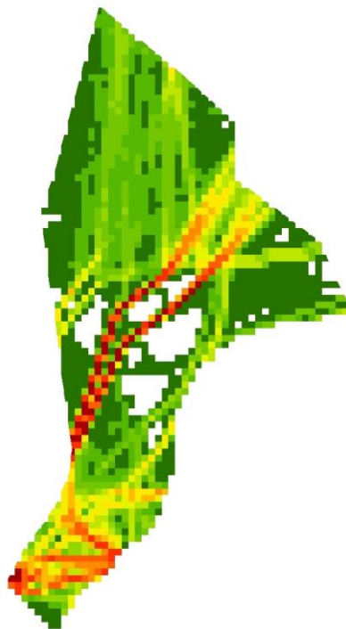
Olietankers: totaal brandstofverbruik (TJ), 5*5km (NCP)